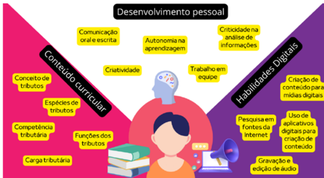
Figura 2. Mapa mental das competências a serem desenvolvidas durante a realização da WebQuest.